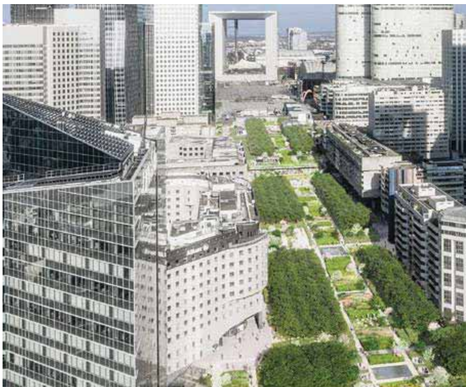
Réaménagement de l'esplanade, composée d'un jardin de 600 mètres de long.