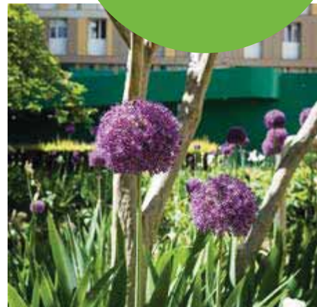
Square des Corolles.

Finis les clichés sur la ville béton ou l'hégémonie minérale ! Aménageur, urbanistes, paysagistes et architectes collaborent activement pour végétaliser le territoire, dans le respect des équilibres naturels et de la biodiversité.