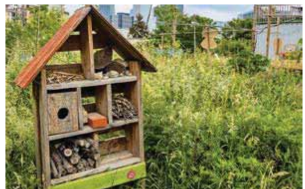
Friche urbaine Vive Les Groues (cf. p. 18)