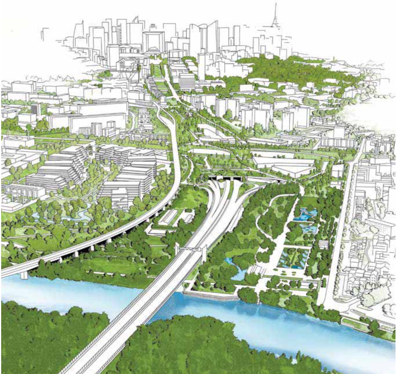
Projet de continuité végétale de La Grande Arche à la Seine.

Pour toutes questions : bordsdeseine@parisladefense.com