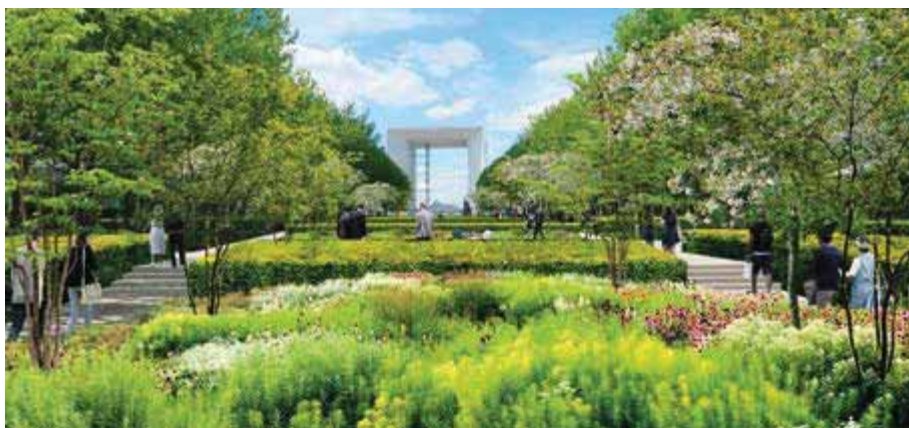
Alternance de places et promenades végétalisées.