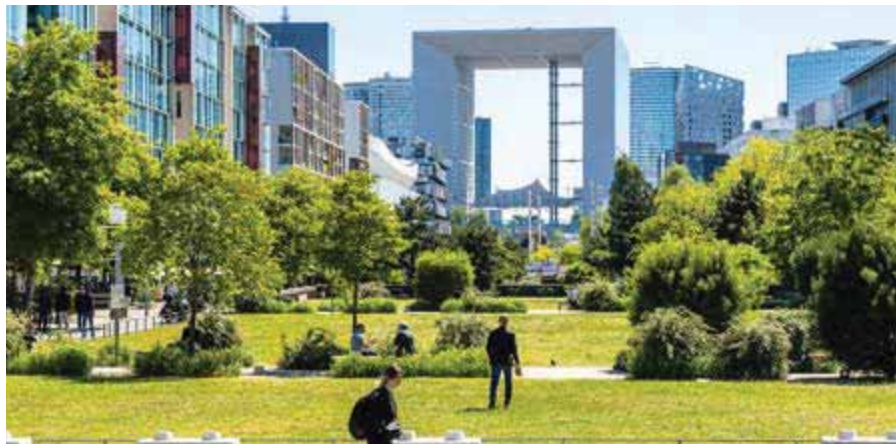
Les Terrasses de Nanterre.