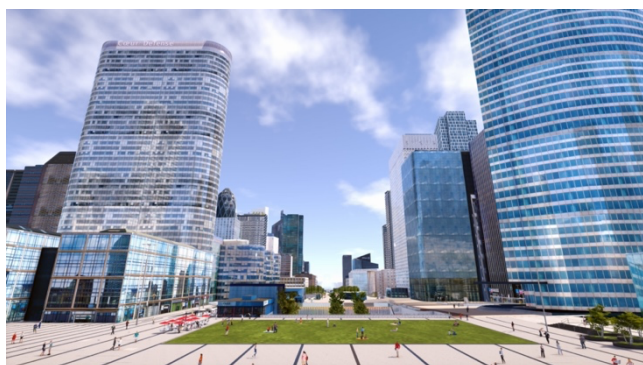
Balade immersive sur la nouvelle place de La Défense

Alliant modernité et digital, Paris La Défense innove avec la mise en ligne d'une carte interactive complète de son territoire. Elle présente une version 3D du quartier d'affaires et de ses projets tels que The Link, la place de La Défense et le nouveau quartier des Groves. Que vous souhaitiez prendre de l'altitude ou évoluer à hauteur d'homme, explorez plus de 550 hectares depuis votre écran !